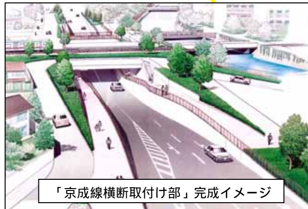
「京成線横断取付け部」完成イメージ

八方橋 拡幅 右折レーンを設置するため、拡幅工事を 行います。 平成23年3月に完成を予定しています。 現在は迂回道路の整備を行なっています。この 工事により、大柏川の東側河川管理用通路が 一時的に通行止めとなりますので、ご理解と ご協力をお願いします。