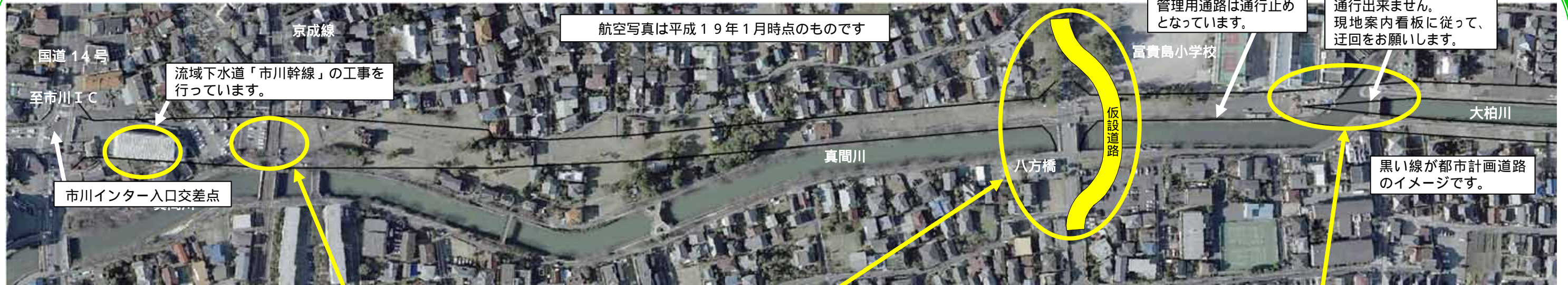
航空写真は平成19年1月時点のものです