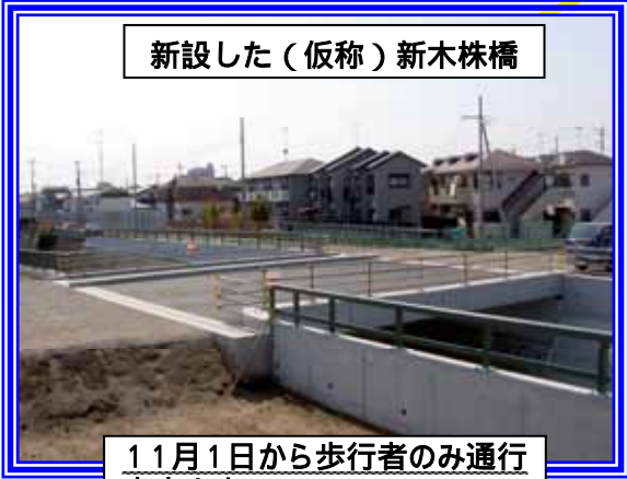
新設した(仮称)新木株橋