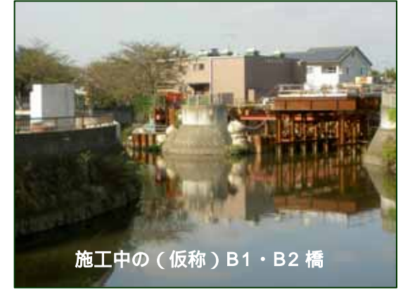
施工中の(仮称)B1・B2橋

八方橋 拡幅 右折レーンを設置するため、拡幅工事を 行います。 平成23年3月に完成を予定しています。 現在は迂回道路の整備を行なっています。この 工事により、大柏川の東側河川管理用通路が 一時的に通行止めとなりますので、ご理解と ご協力をお願いします。