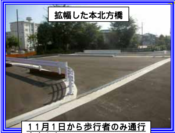
拡幅した本北方橋