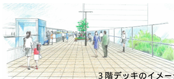
3階デッキのイメージ