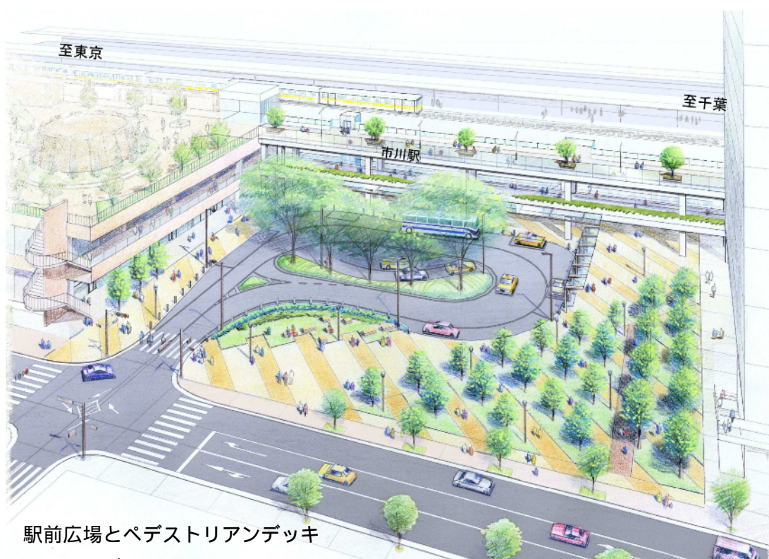
駅前広場とペDESTリアンデッキ のイメージ図

この駅前広場が、市川駅南地区における交流と緑の拠点となるような整備を目指します。