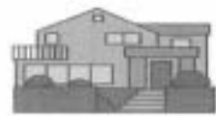
NPO法人 住まいのサポートセンター (まちづくりの推進)

「住まい」は大切な資産！！ より良いまちづくりのために、 建物に関して・・・ ①講演会 ②相談会 ③建物 診断などの事業を行います。