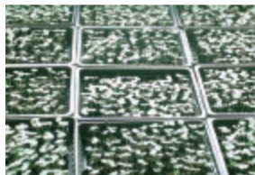
配布予定のケナフの苗

刈り取ったケナフの回収期間・場所 9月8日(月)～11日(木)/市民会館 ※希望者には、紙すきのお手伝いをお願いします(詳細は、回収時に案内)。