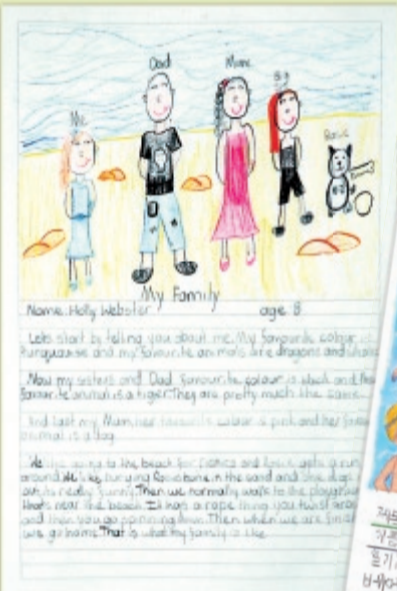
▲オーストラリアから

日時 10月24日(金)午後1時~5時 10月25日(土)午前10時~午後4時 10月26日(日)午前10時~午後4時 会場 文化会館小ホールホワイエ