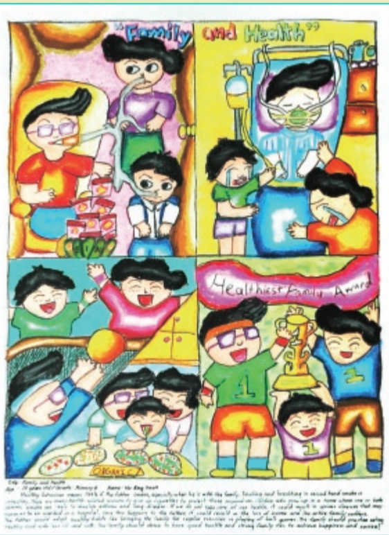
▲シンガポールから