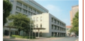
分科会などの会場となる千葉商科大学(右奥は和洋女子大学)