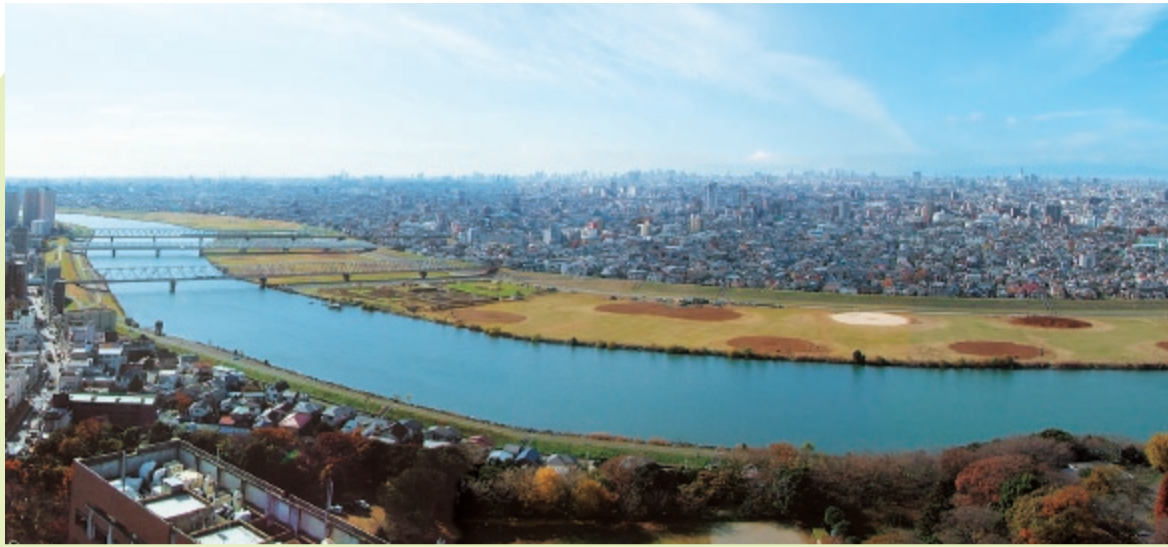
▲当日、一般開放される和洋女子大学の展望レストランからの眺め。江戸川を眼下に、晴れば富士山も見える大パノラマが広がります。