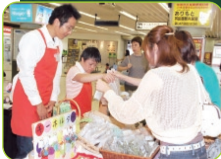
9月の「ハートフルギャラリー福祉の店」で