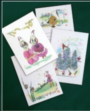
感性豊かな絵はがき