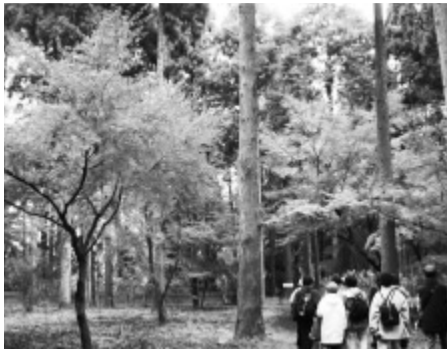
自然観察園もみじの里

コース JR市川大野駅(集合) ▶ 万葉植物園 ▶ 大野城址 ▶ 法蓮寺 ▶ 市営霊園 ▶ 動植物園 ▶ 自然観察園 ▶ 礼林寺 ▶ JR市川大野駅(解散) 12月5日(金)午前10時～午後3時頃 ※小雨決行