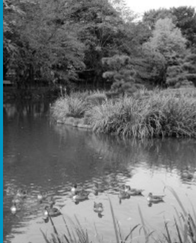
水鳥も憩うじゅん菜池緑地

コース 京成国府台駅(集合) ▶ 里見公園 ▶ 国府台緑地 ▶ じゅん菜池緑地 ▶ 小塚山公園 ▶ 堀之内貝塚公園、緑地 ▶ 京成バス停堀之内3丁目(解散) 11月21日(金)午前10時～午後3時頃 ※雨天中止