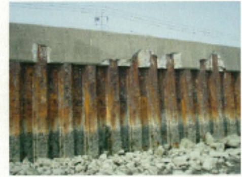
上部コンクリート剥落