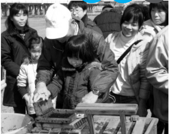
▲初めての手すき体験にドキドキワクワク。おいしくなれ!