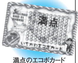
満点のエコポカード

3月28日(土) 第2回寺のまち回遊展に出店するJA朝市組合の店 ●先着100人