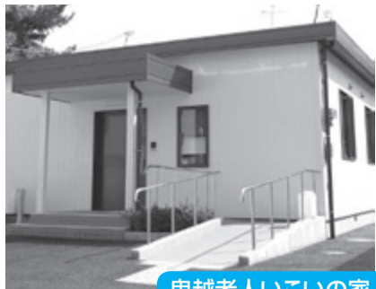
鬼越老人いこいの家