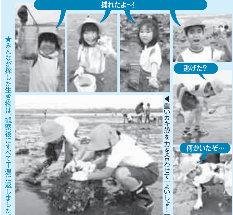
★みんなが探した生き物は、観察後にすべて干潟に戻しました。