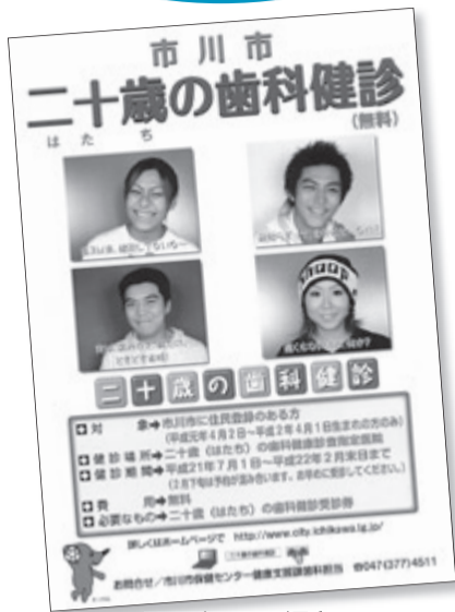
このポスターが目印