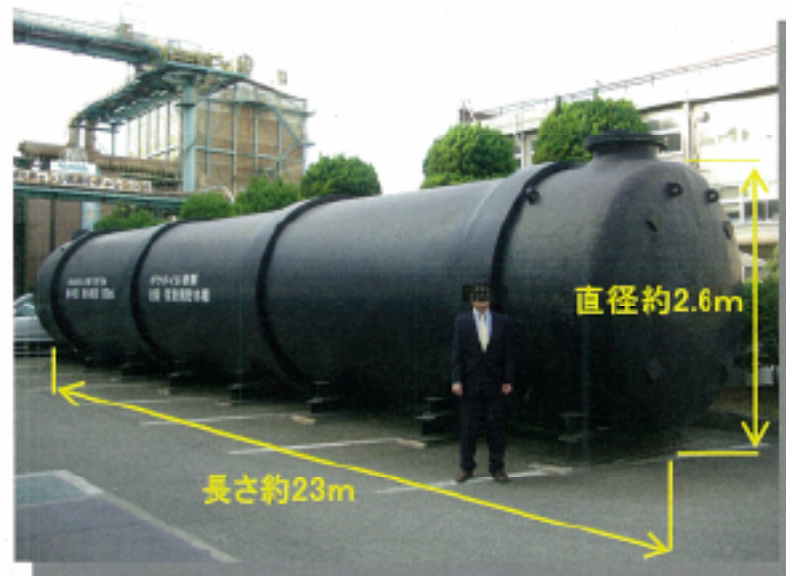
工場検査：実物と同モデルです