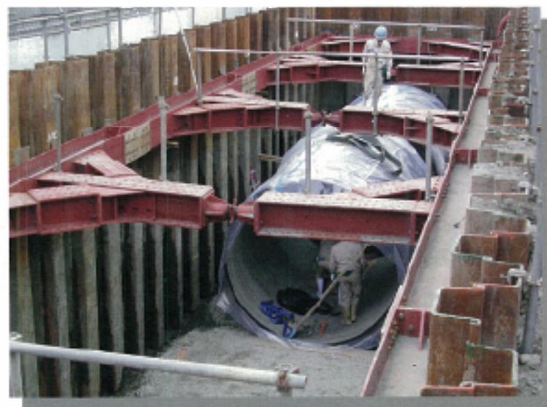
施工状況：1本ずつ吊り降して組み立てます