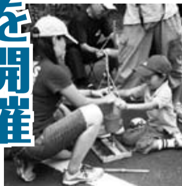
ボランティアが親切に指導する火おこし体験。

8月22日(土) 午前10時～午後3時 会場 ● 考古博物館 ● 歴史博物館 ● 堀之内貝塚公園