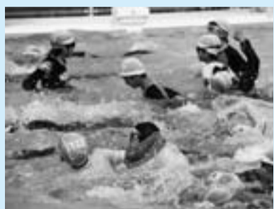
▲がんばれ、あと少しだ! ▲あれ、いつもみたいに泳げないな

二人一組になって助け合う練習では、「ほら、こちだよ」「がんばって」と精一杯腕を伸ばして友だちを引き上げますが、その重さに「引きずり込まれると危ないよ」「大人を呼んだほうがいい」と難しさを実感した様子。「一度体験しておくよ、ぜんぜん違うと思う」「おあさんにも教えたい」と、子どもたちにとっては貴重な体験となったようでした。