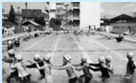
まずは壁際を2周。歩きにくいけど楽しいよ!

「重いよ」「服がくっついて気持ちわるい」。プールサイドに上がった子どもたちから悲鳴にも似た声が響きます。次はクロールと平泳ぎに挑戦。「楽勝だよ」「泳げるよ」と胸を張っていた子どもも、「腕がががら」「ジーンズが重過ぎ!」と動きがままならぬことになり、