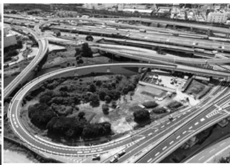
国道357号線と接続する暫定JCT