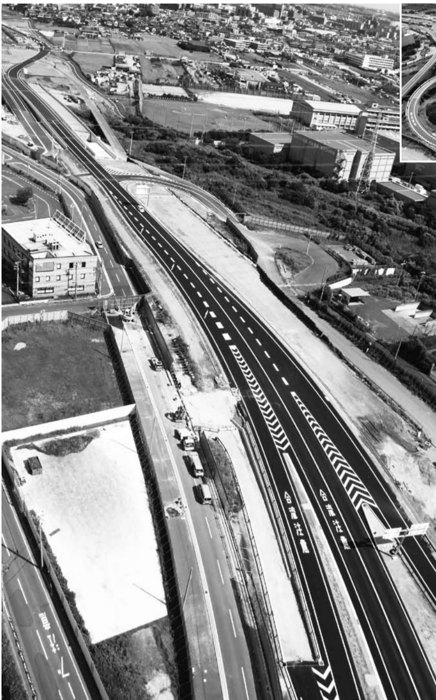
高谷JCTから市街地へ向かって伸びる外環国道部の暫定車線