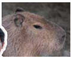
スタッフから一言

この春、カピバラが仲間入り。さらにレッサーパンダ、リスザルに赤ちゃんが誕生、大阪からはコツメカワウソウが到着し、一気ににぎやかになりました。「お客さんの温かさは動物たちにも伝わるようです」と園長が語るアットホームな雰囲気をぜひ感じてください。