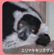
エリマキキツネザル