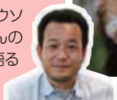
スタッフから一言

なかよし広場では、モルモット、ヒヨコ、お天気がよければヤギ、ヒツジ、ミニブタと触れあえますよ。→