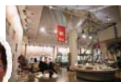
スタッフから一言

都市化が進む中にも残る市川の自然と、そこでいきいきと生活する動植物を水槽や標本、パネルで立体的に紹介しています。相談コーナーで、秋に出会える花や木の実、昆虫を学芸員に尋ねてみましょう。