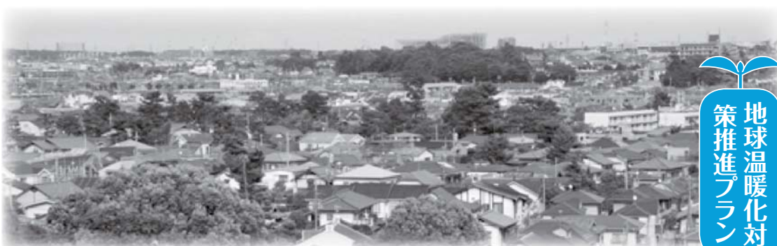
黒松の木々と共生する街並み