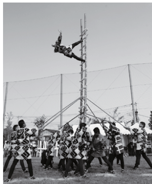
今年も伝統芸「木遣り」「はしご乗り」の妙技が披露される