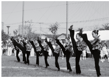
決めのポーズに会場から歓声が沸き上がる