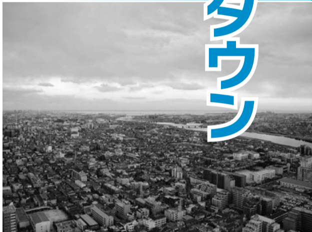
日の出時間 2010年1月1日 午前6時50分 アイリンクタウン(北緯35度43分33秒 東経139度54分33秒)

市川のランドマーク「アイリンクタウン」いちかわザ・タワーズ・ウエスト45階の展望施設を平成22年元旦に特別開放します。市内で一番高い地上150メートルの展望施設から初日の出をご覧になりませんか。 日 平成22年1月1日(祝)午前6時～8時 場 ザ・タワーズ・ウエスト45階展望フロアと屋上階(市川南1の10の1)※強風の際は屋上階への入場は中止する場合があります。 申 市内在住の方、抽選で88組(1組4人まで)往復はがき(1枚に1組まで、複数申し込み不可)に参加者全員の住所・氏名・電話番号、返信用のあて先を書き、12月14日(月)必着で市観光交流担当へ。 公開抽選 12月16日(水)午後2時/アイリンクタウン展望施設45階展望フロア 問 ☎7040057同担当