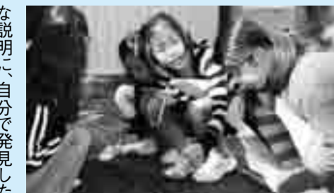
川の上流と下流では何が違うかな?

授業が始まると、5年生が流れの周りに座り込み「ここに水が溜まっているよ」「川の中流ってどこかな」「あ、土に模様ができている」と覗きこみます。やがて指で水を触ってみたり、落ち葉で泡をすくってみたりと、アプローチもどんどん積極的。「川の上流から下流まで見渡せたのがよかった」「カーブの内側と外側で削られ方が違うのは発見でした」「葉っぱを流したら止まる所があつて、きつと土がたまっているのだと思いました」。一生懸命