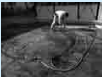
▲盛られた土の傾斜を利用した「流水実験場」