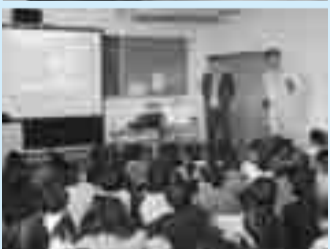
▲午後は新井小学校のそばを流れる江戸川について学びます