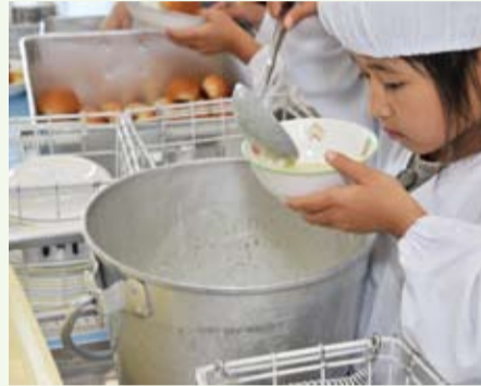
▲さやむきをしたグリーンピースとポテトのスープが給食のメニューに

を中心とした行事食や旬の食材を積極的に献立に取り入れ、興味につながるよう毎日プリントを配っています。野菜や噛みにくいものを苦手とする子どもが多いようですが、「大人がおいしいねと食べるのを聞いて、挑戦する子もいます」と川口さん。食事のマナーも含め、大人が率先して楽しい食卓のお手本になることが大切だと言います。