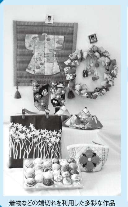
着物などの端切れを利用した多彩な作品