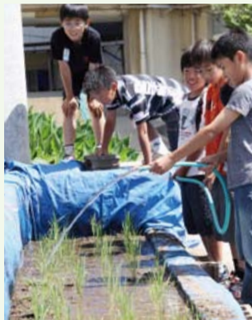
◀田が乾いていないが毎日チェックします