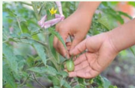
▲校庭では米のほかにトマトやナス・ピーマンなどが子どもたちの手で栽培されています

れるようなお米にしたい」。収穫するまで未知のことばかりですが、日々成長する苗に夢は膨らみます。