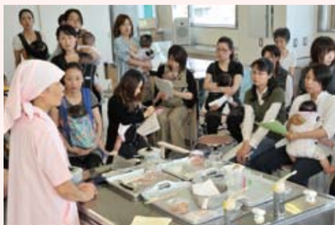
▲離乳食について熱心に話を聞くお母さんたち