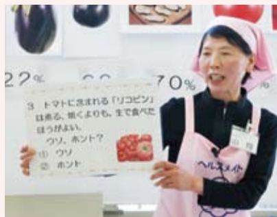
▲クイズ形式で夏野菜を紹介