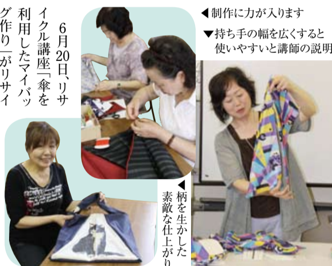
◀制作に力が入ります ▼持ち手の幅を広くすると使いやすいと講師の説明

6月20日、リサイクル講座「傘を利用したマイバッグ作り」がリサイクルプラザで行われました。汚れてしまった傘だけど、お気に入りだったのを捨てられなかった、不用品が、自宅にたくさんあったと、参加者は講座を待ち望んでいたようです。傘の生地を骨組みから外し、オリジナルのマイバッグを作ります。「水をはじくので、雨の日に最適」と、参加者はそれぞれの作品に、満足されている様子でした。