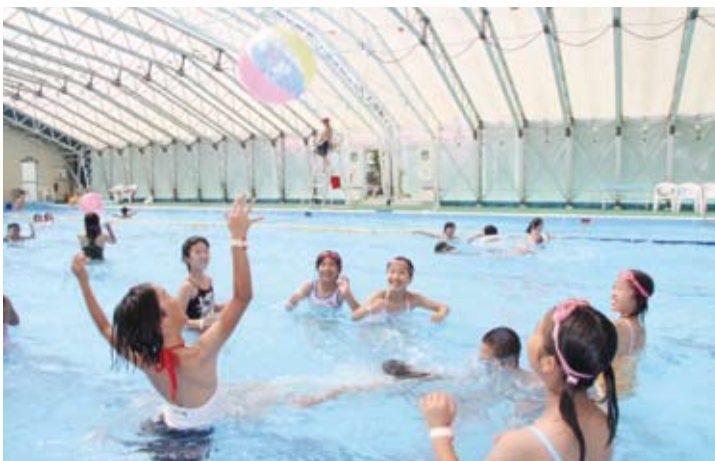
▲ビーチボールで笑顔あふれる

いよいよ夏本番、蒸し暑い日が続きます。家族や友人を誘って、プールでリフレッシュしませんか。