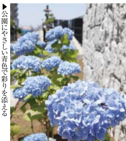
▶公園にやさしい青色で彩りを添える

常夜灯を 見守る紫陽花 梅雨の晴れ間に常夜灯公園を散歩していると、道沿いには紫陽花が風に吹かれ、頭を揺らしていました。昨年11月に植えられた紫陽花は、まだ小ぶりながらもしっかりと根をはり、陽に向かって花開いていました。今後さらに株も増えて、道行く人や、常夜灯をも見守ってくれることでしょう。