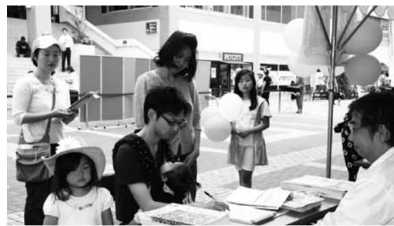
1%支援PRイベントにて届け出の様子

日8月1日(日) 場①消防局 5階ホール 午前10時～正午 ②行徳文化ホールI&II会議室1・2 午後2時～4時 ※車での来場は遠慮ください。 問☎334-1104企画・広域行政担当