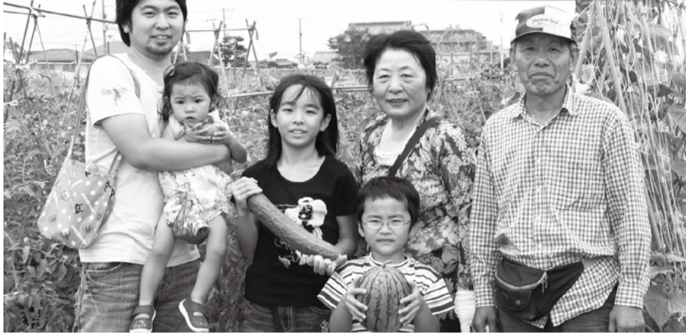
育てた野菜の収穫に笑顔があふれます。(原木市民農園にて)

市民農園は、休耕地の有効活用を図るとともに、レクリエーションの場を提 供し、市民のみなさんに農業への理解を深めてもらうことを目的 として、昭和52年に開設されました。現在は9カ所の市民農園を 市民の皆さんにご利用いただいています。 今回は、新たに開園される柏井町2丁目市民農園の利用者を募 集します。ご家族や友だちと一緒に、野菜や花などを栽培して楽 しんでみませんか。