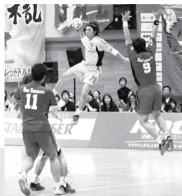
シュートをねらう大崎電気チームの選手

「ゆめ半島千葉国体」が、より多くの方に支えてもらえるよう、スポーツの魅力伝える催し物を行います。