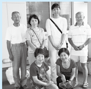
ナチュラルエコライフサポート(NES) 自然環境にやさしい活動を広める会の皆さん