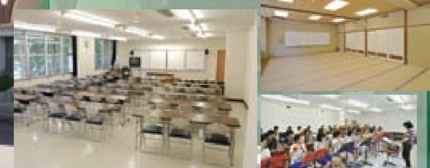
市内中学校の brass band の練習

80人、50人収容の2つの研修室と、和室、視聴覚室があります。また体育室(縦25m、横15m)は、スポーツのほか室内でのレクリエーションに利用できます。