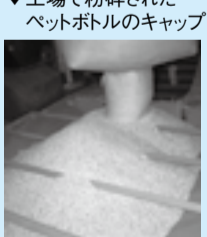
▼工場で粉砕されたペットボトルのキャップ