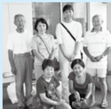
ナチュラルエコライフサポート(NES) 自然環境にやさしい活動を広める会の皆さん