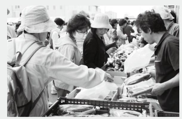
新鮮野菜の販売は大人気(昨年)

年に一度、地方卸売市場(鬼高4の5の1)を開放して行う「いちかわ市場まつり」。今年は、9月26日(日)に開きます。当日は、青果物、乾物、お茶、肉、飲み物、卵などの食料品や花、日用雑貨品も販売します。また、やさそばやゲームの出店、模擬せりなどの各種イベントも予定しています。どうぞ、みなさんお誘い合わせのうえ、ご来場ください。