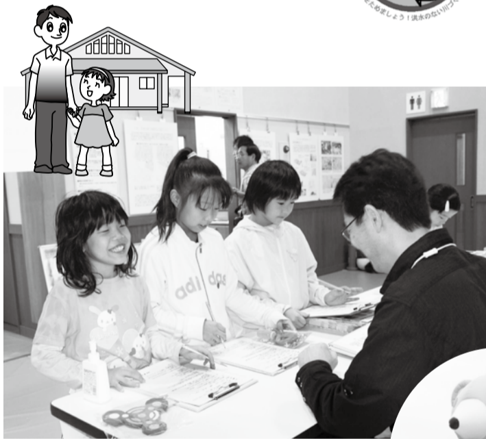
クイズの答えに迷ったらヒントもサービス