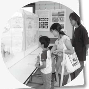
治水対策をパネル展示で分かりやすく解説

年に一度、地方卸売市場(鬼高4の5の1)を開放して行う「いちかわ市場まつり」。今年は、9月26日(日)に開きます。当日は、青果物、乾物、お茶、肉、飲み物、卵などの食料品や花、日用雑貨品も販売します。また、やさそばやゲームの出店、模擬せりなどの各種イベントも予定しています。どうぞ、みなさんお誘い合わせのうえ、ご来場ください。