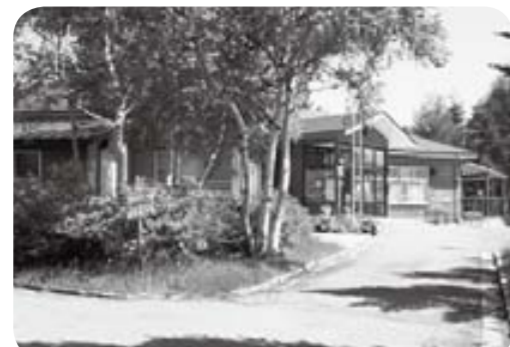
▲菅平高原でも最も標高が高い峰の原に位置するいちかわ村