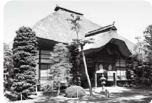
▲季節毎の花に囲まれ「花の寺」とも呼ばれる前山寺

「菅平高原いちかわ村」では、宿泊利用者を対象に秋の特別企画を行います。初日は上田駅からバスで別所温泉と紅葉の見所「前山寺」などへご案内。名物の「くるみおはき」も楽しめます。翌日は、観光農園で「リンゴ狩り」を行います。特に、11月5日(金)は、天気がよければ槍ヶ岳に夕日が沈むサンセットがいちかわ村から楽しめます。 ※送迎以外は実費負担となります。