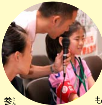
「お豆運び大会はどうだった?」「ツルツルすべって難しかったです」

との撮影コーナーではとてもにぎわっていて、チビッコたちは大喜びでした。フェアで働いていた人たちは、とても優しく、私たちは楽しく参加できました。