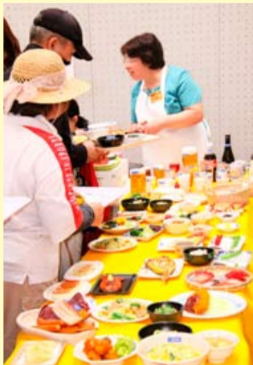
▲「SATシステム」の食べ物レプリカが並んでいます。どれも、美味しそうですね。