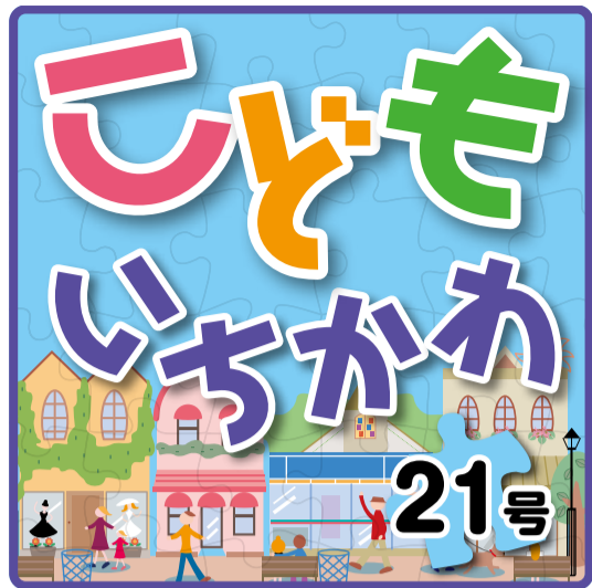
「こどもいちかわ」は、小・中学生がこども記者となり、テーマを決めて取材しています。(年2回発行)