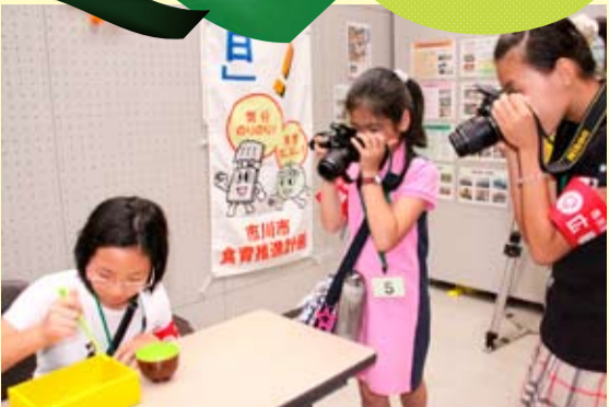
▲お豆を運ぶのは大変。でも、いいところを写すから頑張る。

7月24日、文化会館で行われた「食育フェア2010」では、さまざまなブースが並んでいました。最初に私たちは、市川の梨を使ったジュースを試飲しました。食感シャリシャリとして、梨をそのままおろした状態で美味しかったです。次に「お豆運び」大会に参加しました。箸がプラスチックなので、豆をつかむのが大変でした。その後は大人気「SATシステム」に挑戦しました。これは本物とくりの食べ物レプリカから普段の献立を選び、食事バランスを診断してもらうものです。ここでは学校給食のレシピも