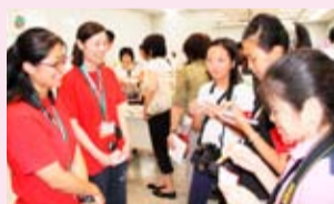
▲国体推進課の方にインタビュー

横を向くと千葉県の形をしていて、市川市は口のあたりです。身長は2mで赤い色をしていて、未知のものに立ち向かうときほど勇気と情熱がわき、からだが赤く輝きます。性格は好奇心旺盛で、食いしん坊。