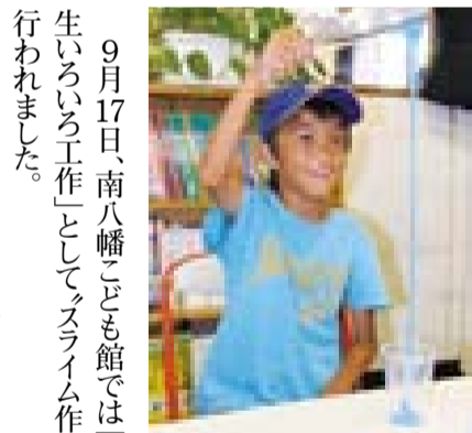
▲気持ちよく伸びるね。違う色でも作ってみようかな

友だちが作るスライムを横目で見ながら量を調節して、それぞれにスライム作りを楽しんでいました。各子ども館では、魅力ある多様な催しを行っていただきますので、ぜひ行ってみてください。 ※ホウ砂には毒性がありますので、取り扱いには注意してください。