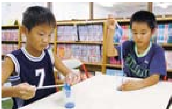
▲硬さの調整がちょっと難しい

友だちが作るスライムを横目で見ながら量を調節して、それぞれにスライム作りを楽しんでいました。各子ども館では、魅力ある多様な催しを行っていただきますので、ぜひ行ってみてください。 ※ホウ砂には毒性がありますので、取り扱いには注意してください。