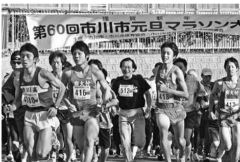
▲ランスタートする参加者(5kmコース)