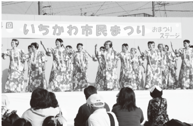
観客を魅了する華やかなフラダンスのステージ

今年のいちかわ市民まつりは、11月6日(土)に大洲防災公園で開催します。市民団体の華やかなステージが行われ、200以上の団体が趣向を凝らして出店します。また「味のある豊かな暮らしの広場」では、グルメ研究会のコーナー、はかってみよう市川のおいしい秋コーナーなど楽しい企画が盛りだくさんです。どうぞ、ご家族そろってお越しください。 (観光交流担当)