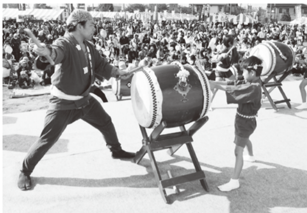
力強い太鼓の音が会場を盛り上げる

今年のいちかわ市民まつりは、11月6日(土)に大洲防災公園で開催します。市民団体の華やかなステージが行われ、200以上の団体が趣向を凝らして出店します。また「味のある豊かな暮らしの広場」では、グルメ研究会のコーナー、はかってみよう市川のおいしい秋コーナーなど楽しい企画が盛りだくさんです。どうぞ、ご家族そろってお越しください。 (観光交流担当)