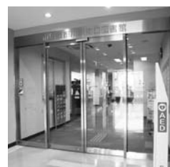
市川駅南口図書館

市川駅南口再開発ビルA街区3階公共公益施設部分に、駅前である立地を活かし、貸出に特化した短時間滞在型の情報拠点として市川駅南口図書館を開設しました。