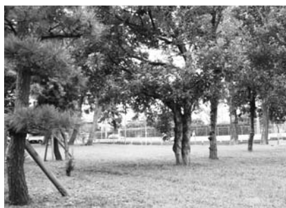
八幡東公園(富貴島小学校正門前)

新たに都市公園、都市緑地として、八幡東公園、北国分2丁目公園、曾谷3丁目緑地の用地を取得しました。