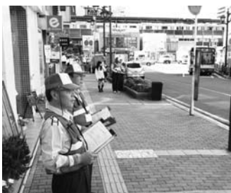
巡回中の推進指導員

健康と安全で清潔な生活環境を守るため、(通称)市民マナー条例を定め、歩きタバコ・ゴミのポイ捨て・犬のふんの放置などについて、啓発・推進を図るとともに、路上禁煙・美化推進地区内の違反には過料徴収を行いました。