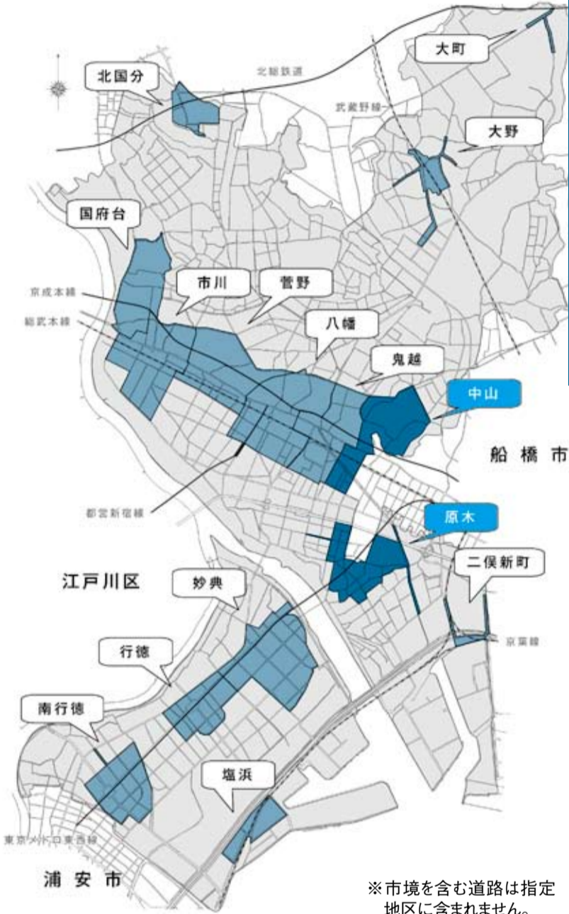
※市境を含む道路は指定地区に含まれません。