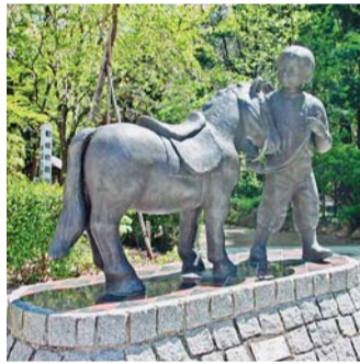
『ポニー』(中野滋) —動物園—