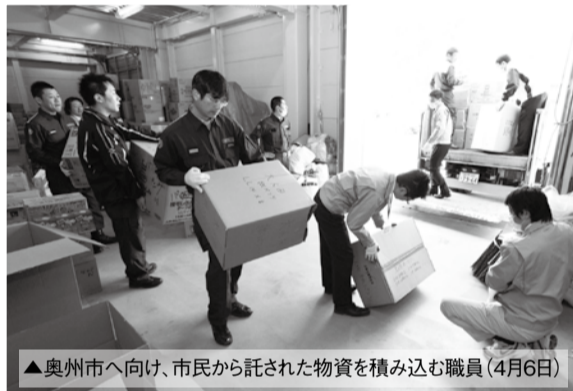
▲奥州市へ向け、市民から託された物資を積み込む職員(4月6日)

東日本大震災の被災者の方々のため、3月26日～4月3日に市民の皆さんから市が託された支援物資は、2トトラック7台分。総勢939人からの善意のうち、3月27日に千葉県を通じて2トトラック1台分を、4月4日に陸上自衛隊を通じて2トトラック3台分を被災地へ搬送したほか、4月6日には直接奥州市などへ2トトラック3台分を届けました。