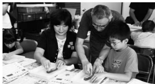
▲粘土を使って形づくり