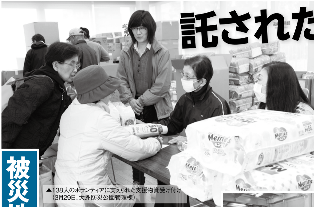
▲138人のボランティアに支えられた支援物資受け付け (3月29日、大洲防災公園管理棟)