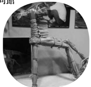
▲五月人形と七夕馬