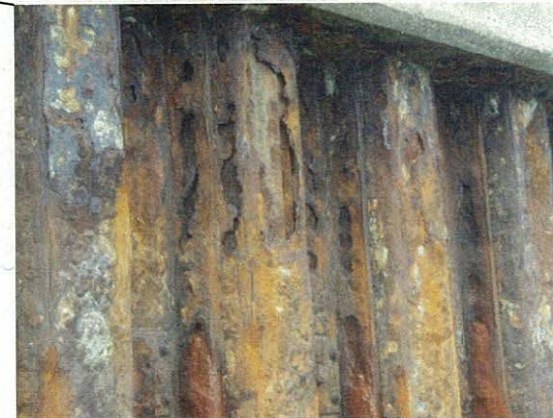
⑥鋼矢板腐食状況 (穴)