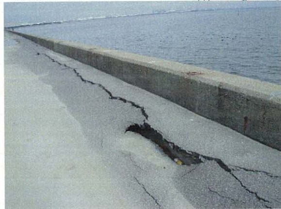
④護岸敷の沈下・陥没