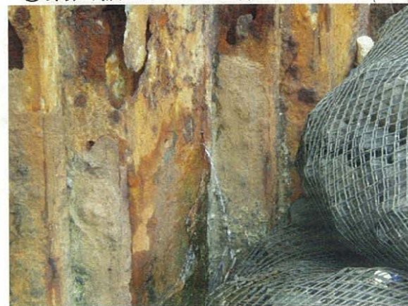
⑤鋼矢板の穴から漏水