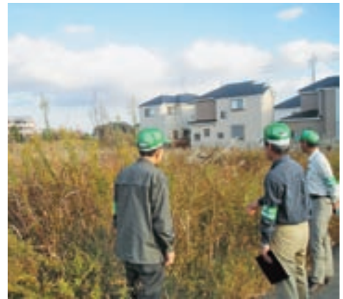
農業委員による農地利用状況調査