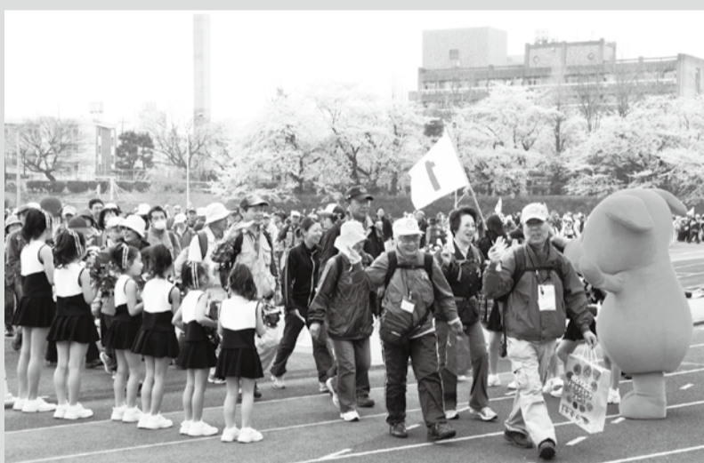
▲桜満開のスポーツセンターをスタート

春の陽気の中、市川市を中心とした名所・旧跡を歩いてみませんか。体力に合わせて5・10・20・40kmの自由歩行コースと、15kmの団体歩行コースを用意しました。健康づくりの第一歩に気軽にご参加ください。なお、小学校低学年と幼児は保護者同伴、障害者は介助者の同行が必要です。