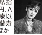
蘭寿とむ ◎宝塚歌劇団▲

2月25日(土)発売 宝塚歌劇 花組 全国ツアー初日ミュージカル・ロマン「長い春の果てに」レピュ・ファンタシーク「カノン」Our Melody 発売初日は文化会館窓口午前10時から、電話予約午後2時から受付。 4月28日(土)・29日(祝) 両日とも①12:00開演②16:00開演 / 文化会館大ホール / 全席指定 S席7,000円、A席5,000円※3歳以上有料 / 出演=蘭寿とむ、蘭乃はな、ほか