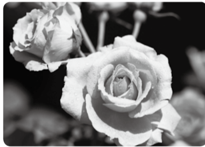
透明感のある薄紫が特徴の「ローズいちかわ」

ここでお知らせする「花と緑の市民講座」は、市川市緑の基金が行う講座です。市民の花であるバラの育て方や、著名な講師による素敵なガーデニング講座、職人の技を生かした生け垣講座など、初心者の方でも基礎から学べます。ぜひこの機会にガーデニングにチャレンジし、「ガーデニング・シティ いちかわ」のまちづくりにご協力ください。