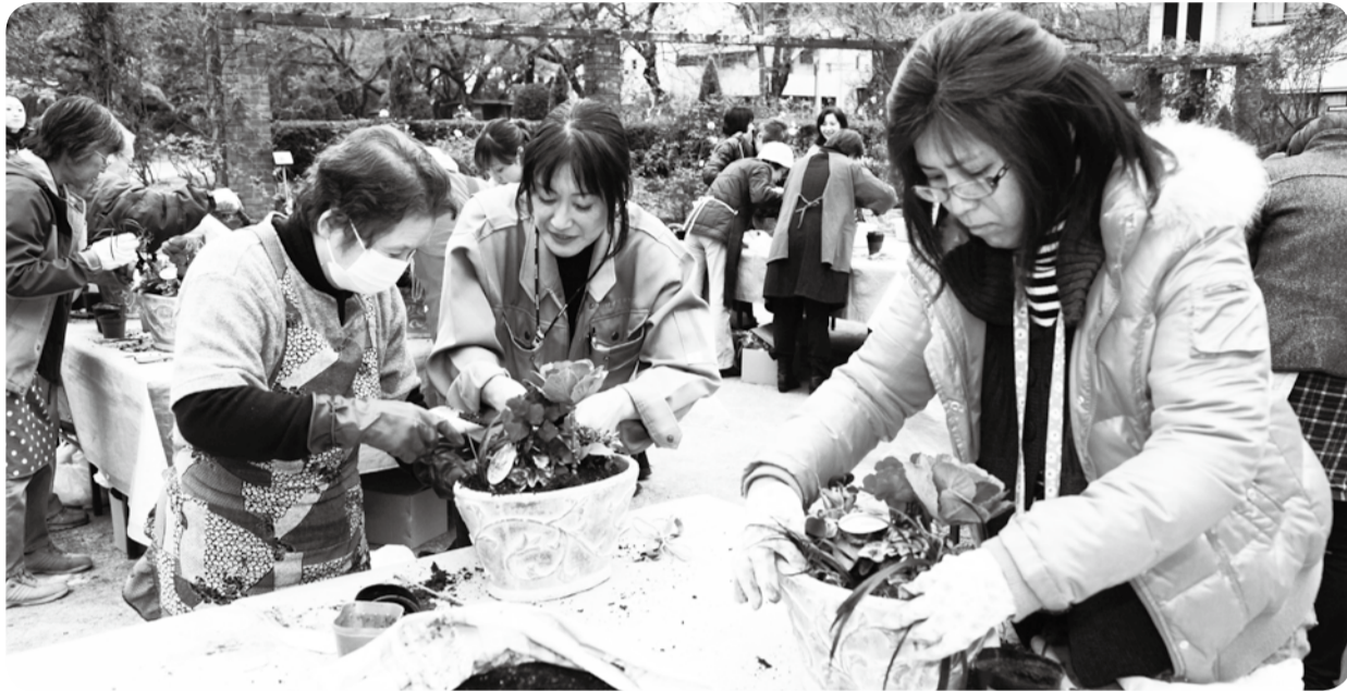
鉢や苗木も受講費に含まれ、気軽に季節の緑が楽しめる(昨年12月の寄せ植え講座)

広報いちかわは新聞折り込みでお届けするほか、市内各駅の広報スタンドと公共施設で配布しています。入手困難な方で自宅への配布をご希望の場合は、広報広聴課へお問い合わせください。