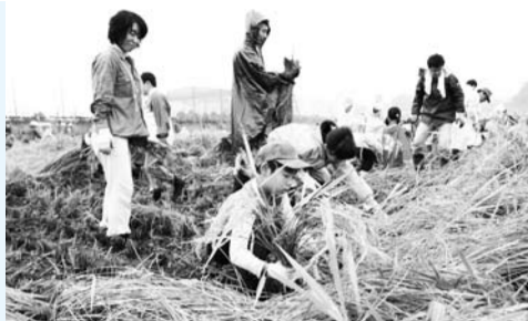
▲貴重な稲刈り体験に子どもも夢中

市内の自然豊かな田園風景の中で、田植えの準備から収穫までの作業を、親子で体験できます。