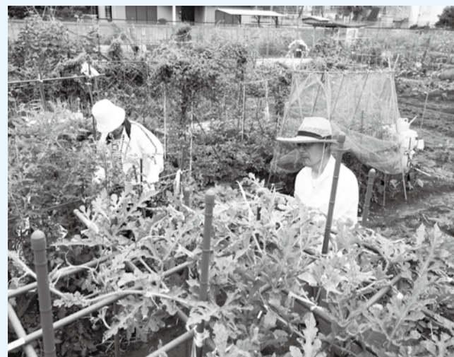
▲春植えの苗で夏に収穫を楽しむ利用者