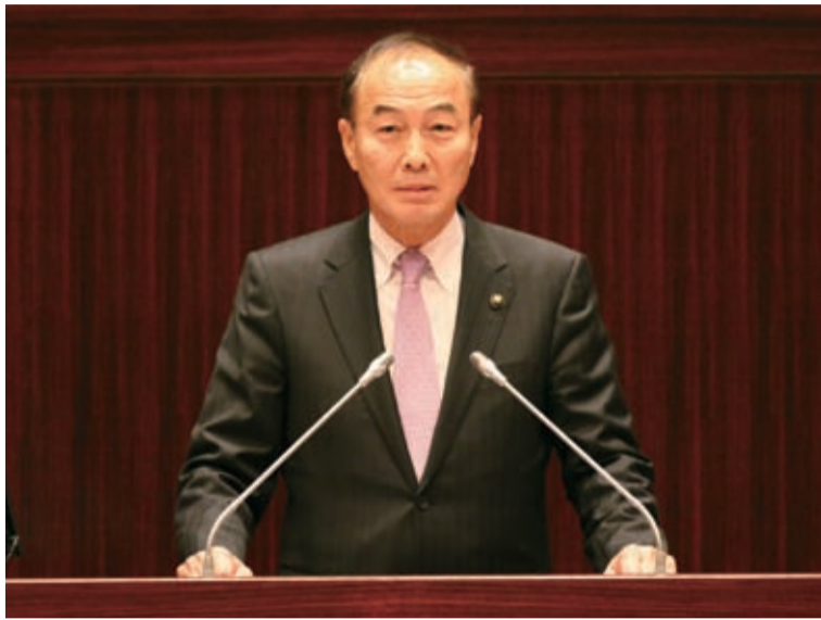
▲施政方針演説を行う大久保博市長