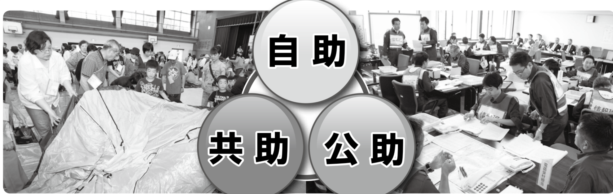
避難所体験訓練でテントの架設を協力して行う参加者(百合台小学校)