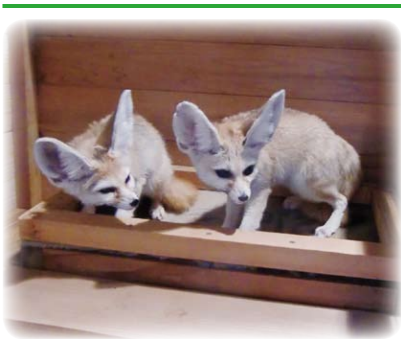
▲新たに仲間入り、公開中のフェネック(キツネの一種)