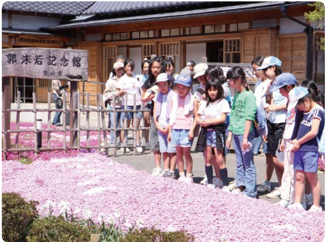
▲芝桜が見頃を迎える郭沫若記念館(5・10・15キロコース)