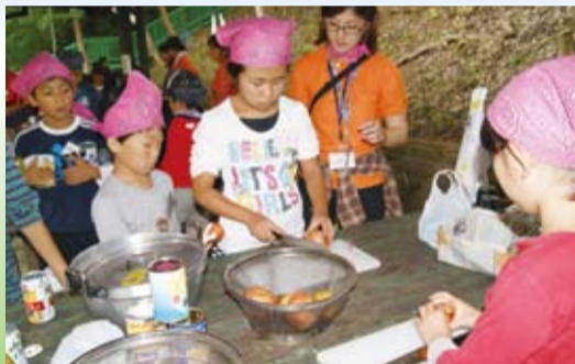
◀青少年相談員に見守られながらカレー作りに挑戦