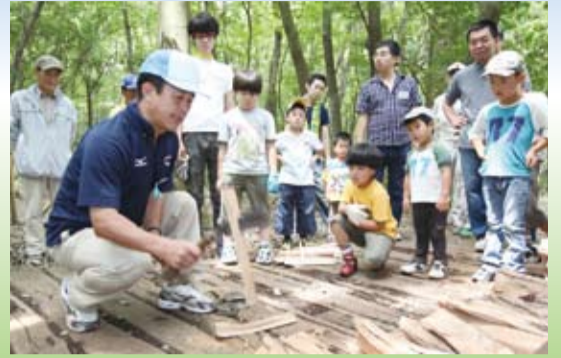
▲炊飯用のまき割りの方を習う参加者達