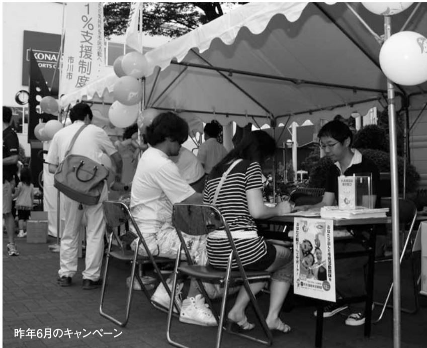
昨年6月のキャンペーン

広報いちかわは新聞折り込みでお届けするほか、市内各駅の広報スタンドと公共施設で配布しています。入手困難な方で自宅への配布をご希望の場合は、広報広聴課へお問い合わせください。