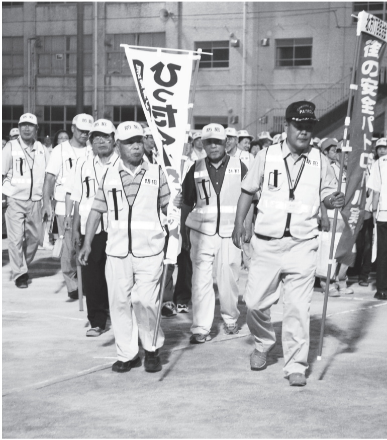
犯罪抑止のため、地域が一体となって防犯活動を展開(鬼高小学校)

広報いちかわは新聞折り込みでお届けするほか、市内各駅の広報スタンドと公共施設で配布しています。入手困難な方で自宅への配布をご希望の場合は、広報広聴課へお問い合わせください。