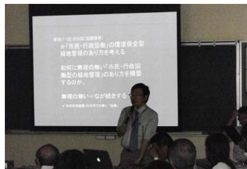
近江先生によるご講話の様子