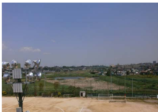
東国分中学校4階より中池方向

これまでも何度か東国分中学校から調節池全体を見ていただいておりますが、調節池の掘削工事が進んでいること、また今後、上部活用事業の運営・管理を検討していくため、あらためて調節池全体を会員の方々にご確認いただきました。図面で見るとそこまで大きく感じないのですが、実際に上から見てみると、広大なスペースというのがお分かりいただけたかと思います。