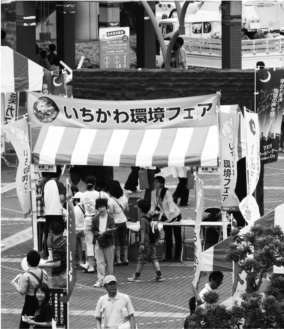
▲環境展やエコスタンプラリーなどで気軽に学ぶことができる

広報いちかわは新聞折り込みでお届けするほか、市内各駅の広報スタンドと公共施設で配布しています。入手困難な方で自宅への配布をご希望の場合は、広報広聴課へお問い合わせください。