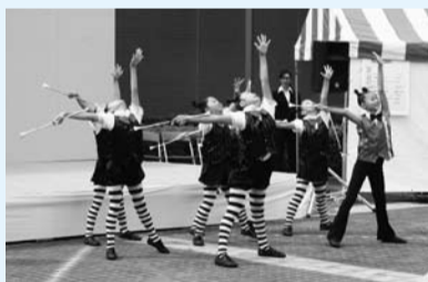
▲バトントワリングショー