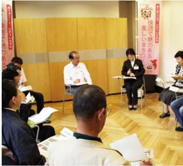
館内で行われた座談会の様子