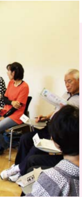
館内で行われた座談会の様子