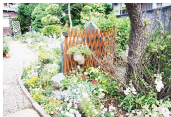
色とりどりの花が利用者を楽しませる

春以上に交流をテーマにしたオープンガーデンを目指していきますので、みなさんぜひいらしてください。