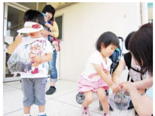
新田保育園では、園内で育てた花苗が子ども達に配られました。