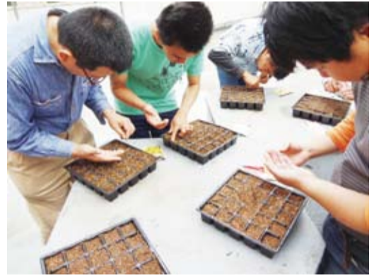
南八幡メンタルサポートセンターでは利用者の中からガーデニング部が発足しました。