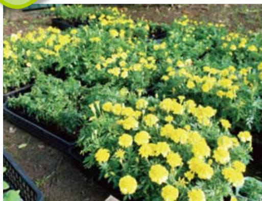
みなさんが育てた花苗が集まりました。これから各施設に配られます。