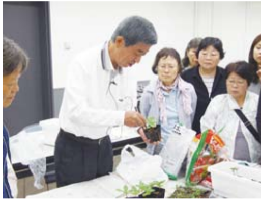
種まきから開花までの育成ポイントを学びました。

種から花を育て鑑賞する楽しみに加え、育てた花の一部をご近所や知り合いに配るのもよし、または公共施設に提供いただくのもよしの取り組みです。市民や学生、保育園の園児・親子などが花を通じた交流の輪を広げています。