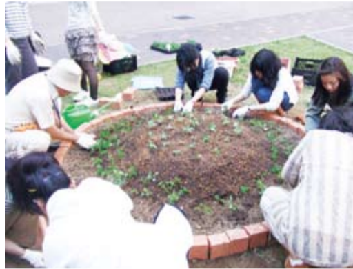
和洋女子大学では「ガーデニングわよう 学内花いっぱい運動」としてスタート。花壇作りにもチャレンジしました。