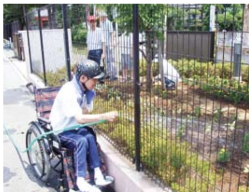
国分にある「松香園」で、いただいた花苗の定植を行いました。